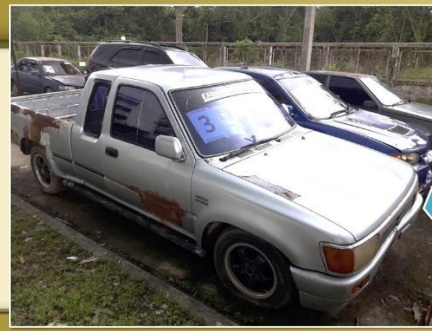
คันที่ 3 รถยนต์ โตโยต้า HILUX สีบรอนซ์