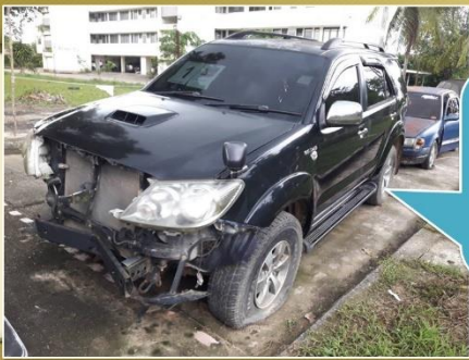
คันที่ 1 รถยนต์ โตโยต้า FORTUNER สีดำ